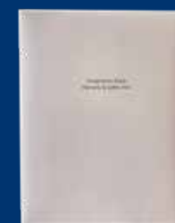
Sikkerhedsinstruktioner (Warranty & Safety info)