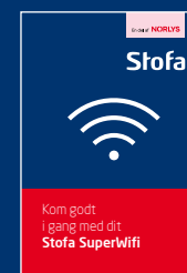
Din Kom godt i gang-vejledning